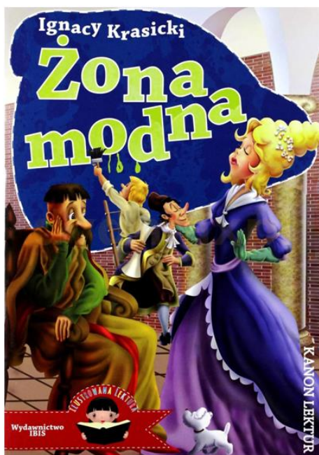
Okładka „Żona modna”, I. Krasicki, wyd. IBIS.